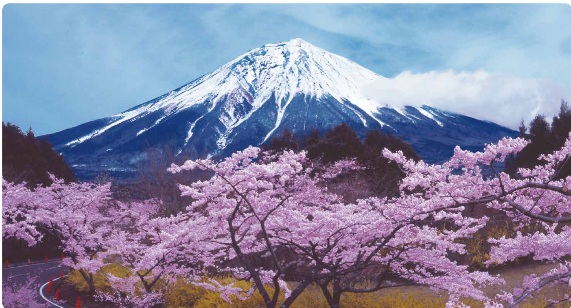
満開の桜（撮影場所 富士宮）