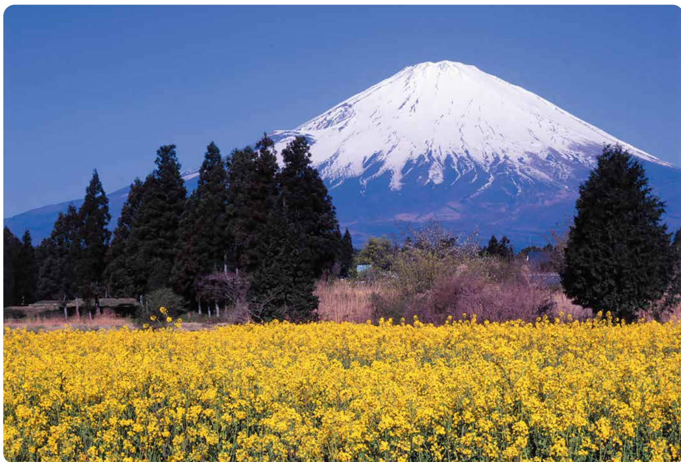
陽春 (撮影場所 御殿場仁杉)