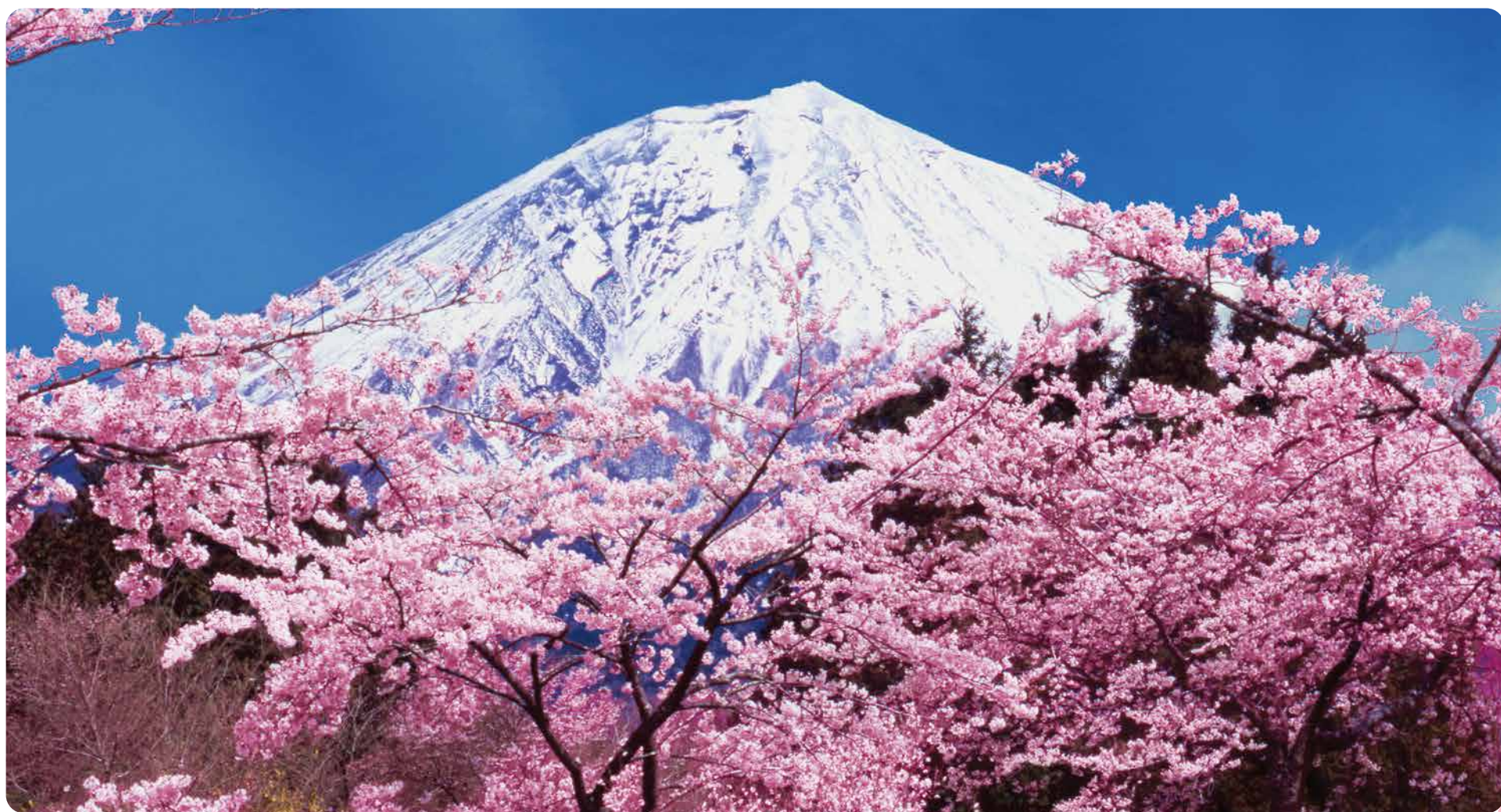
満開の桜 (撮影場所 富士宮)