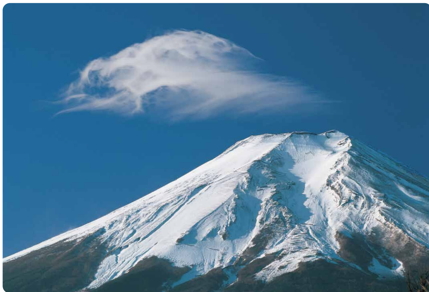
羽衣 (撮影場所 北富士演習場)