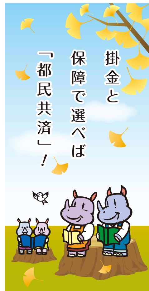
都民共済マスコットキャラクター「キョーサイ」家族